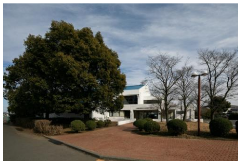
体育館全景 (屋根及び外壁塗装)