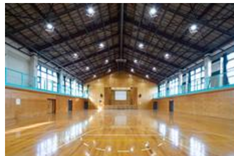
アリーナ (照明のLED化)