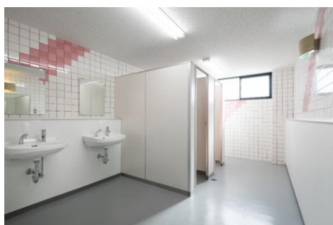
女子トイレ (全面リニューアル)