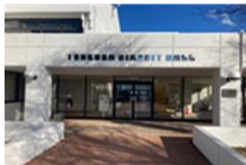
エントラント (外壁塗装)