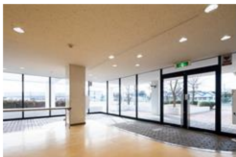
エントラントホール (照明のLED化)