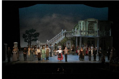
公演の様子②（2022年2月20日）