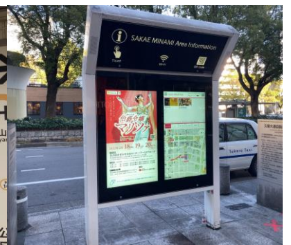
名古屋市営地下鉄等デジタルサイネージ広告