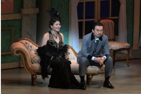
公演の様子①（2022年2月19日）