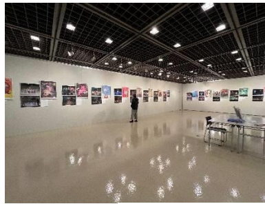
ポスター・写真展