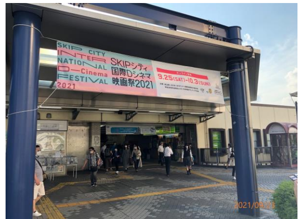
川口駅前の横断幕