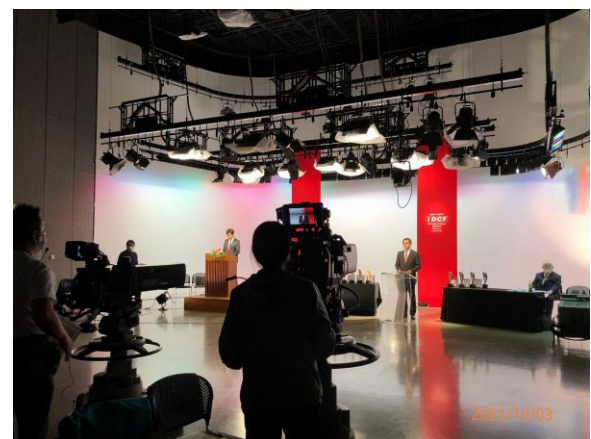
授賞式ライブ配信スタジオ