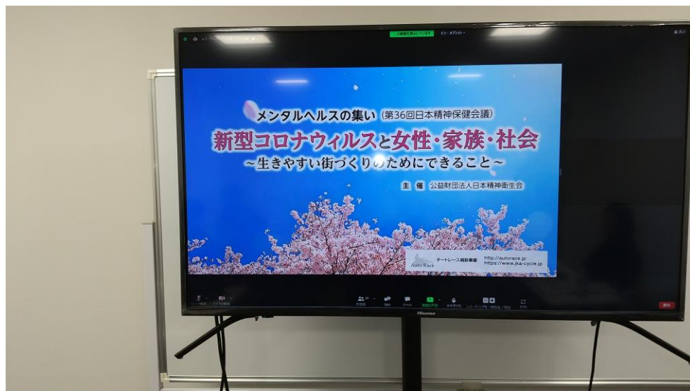
オンラインフォーラム スタート画面

2022年3月5日(土)にZoomウェビナーを利用したオンラインで、精神保健フォーラム「メンタルヘルスの集い」を開催した。テーマは「新型コロナウイルスと女性、家族、社会～生きやすい街づくりのためにできること」で、保健師、臨床心理士、看護師などの専門職の他、支援者や学生、一般市民など全国から249名が参加した。