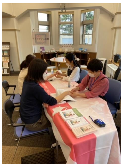
ういケアみなと さくらウィーク出展