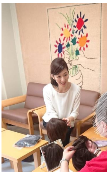
ピアランス：サポート相談

行政や医療者との連携により、病院や行政の施設以外にも美容室やイベントなど、がん患者さんが気軽に相談できる場をつくり、専門知識を持つ美容専門家が外見に関する悩みなどにアドバイスすることで患者の苦痛を軽減する。