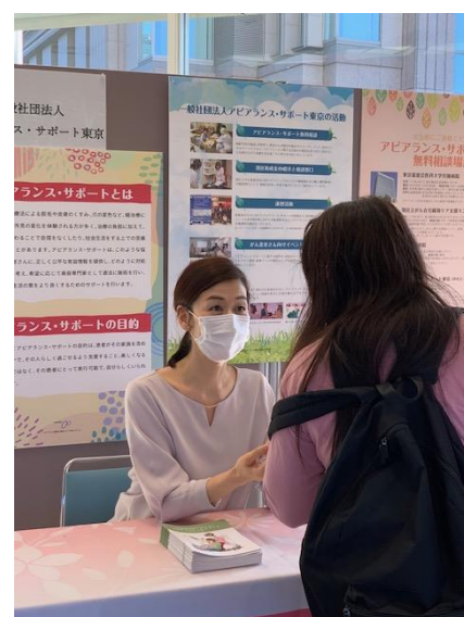
港区がん対策2020 相談ブース出展