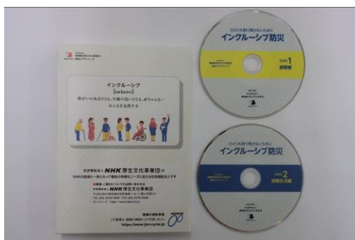
インクルーシブ防災DVD

https://www.npwo.or.jp/video/18792 (URL)