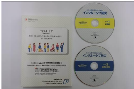
インクルーシブ防災DVD