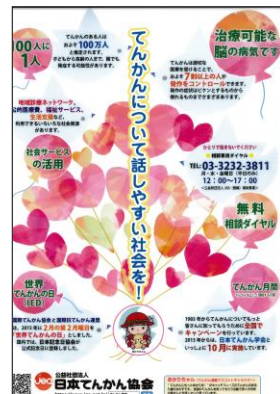
てんかん啓発資料配布用クリアファイル