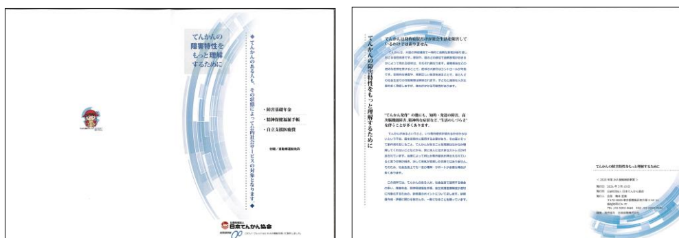
障害認定基準資料（パンフレット）「てんかんの障害特性をもっと理解するために」