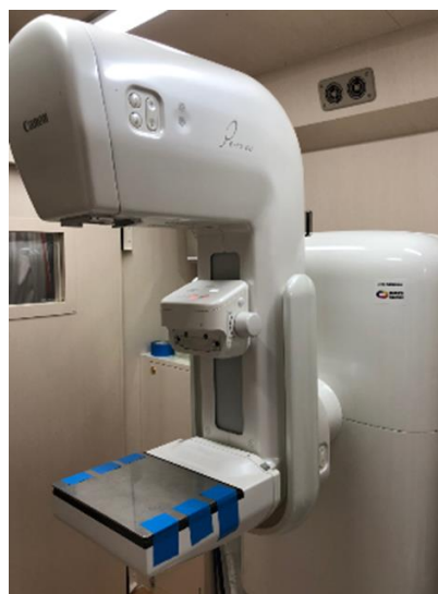
マンモグラフィ装置