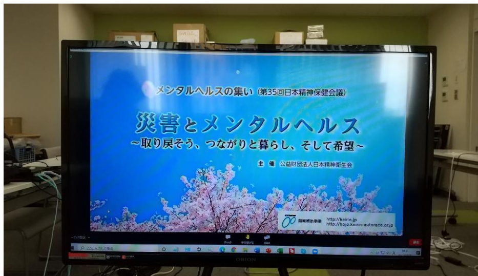
オンラインフォーラム スタート画面

精神保健フォーラムの開催 ( http://www.jamh.gr.jp/gyouji.html#mental ) 令和3年3月6日(土)にZoomウェビナーを利用したオンラインで、精神保健フォーラム「メンタルヘルスの集い」を開催した。テーマは「災害とメンタルヘルス～取り戻そう、つながりと暮らし、そして希望～」で、当事者やその家族、精神保健福祉従事者、支援者など全国から182名が参加した。