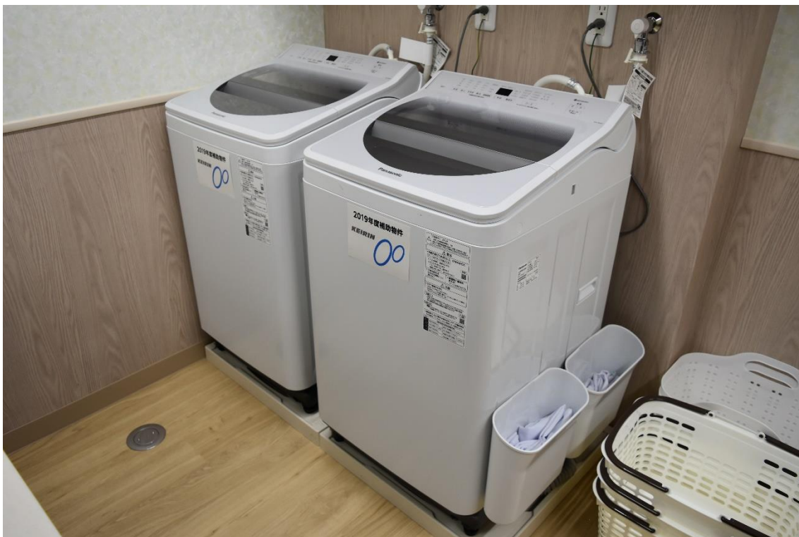
<洗濯機（補助対象初度調弁）>