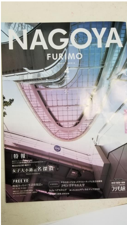
地域フリーペーパー「名古屋フリモ港版」表紙