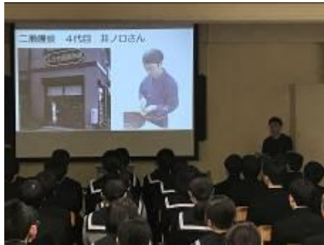
二瀬饅頭 (地域の職人)