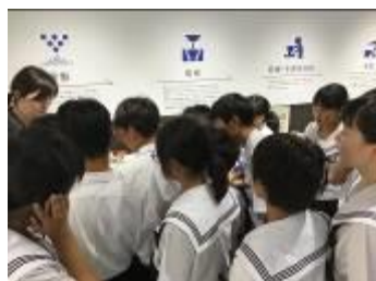
エコタウンセンター