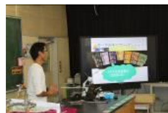
ガーナ（理数科教育）