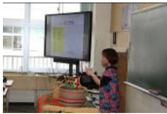
ガーナ (コミュニティ開発)