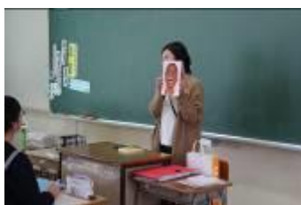
マラウイ（理数科教育）