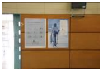
JKAポスターによる広報