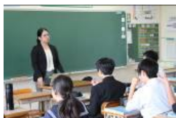
カンボジア（染め物）