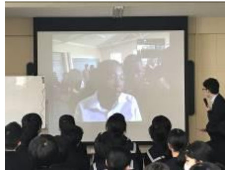
マラウイ (国際的な職業視点)