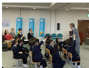
積極的に発言が出ます！