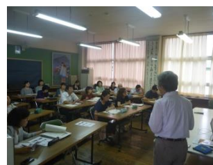
子どもたちのために、先生も勉強中