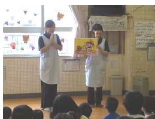
食事のマナーが学べる【ケーキ編】