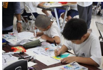
先生たちも驚くほどの集中力！