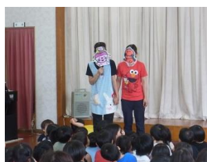
お面をつけて、劇風にアレンジ