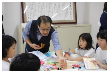
どんな絵を描いているのかな？