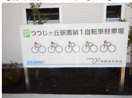
【補助看板 (PR用・拡大)】