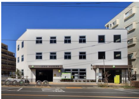
【外観（正面・北向き）】