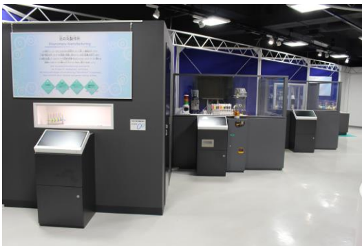
4ブースからなる展示概観

本事業で製作する展示は、科学技術館2階「ものづくりの部屋」展示室に設置する。実機を用いて、実際にモノづくりの工程・過程の一部を示すとともに、機械要素技術・加工技術・素材のいろいろを紹介し、それらが活躍する産業を概観できるよう表現する。IT・IoT・AI等の発達により訪れているモノづくりの構造的な変革に触れるとともに、日本にとっての「モノづくりの役割と意義」を伝え、どのような製品であっても「モノは人が作り出していること」を描き、あわせてそこで活躍が期待される人材像についても表現する。