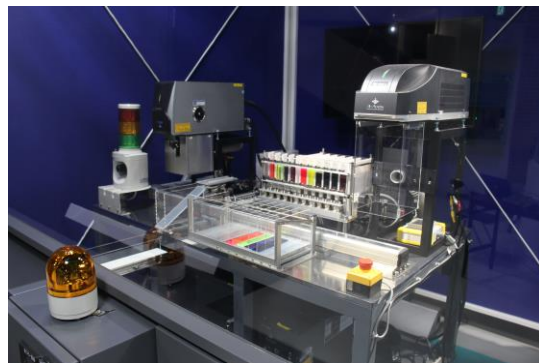
アクリルメダル・定規生産ライン