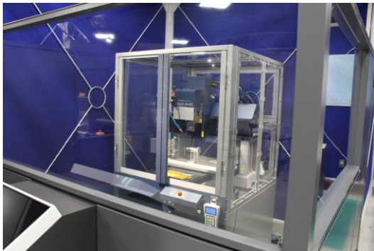
小型マシニングセンター