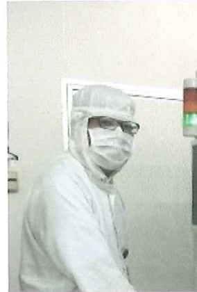
補助事業による装置利用