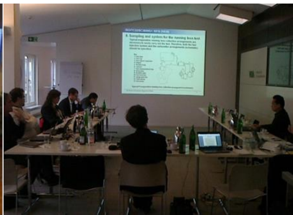
(キャプション: ISO会議風景 11月ドイツ)