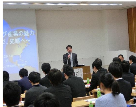
キャリア支援セミナー福岡