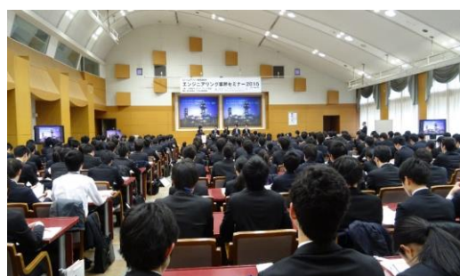
エンジニアリング産業研修会(東京) パネルトーク