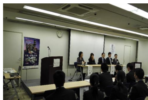
エンジニアリング産業研修会(大阪) パネルトーク