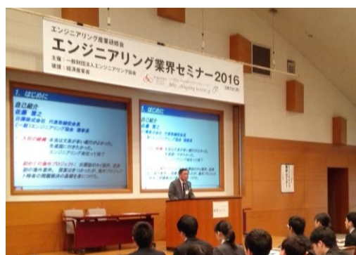
エンジニアリング産業研修会(東京)基調講演

また、エンジニアリング体験セミナーや各大学で実施したエンジニアリングマネジメント講座に多くの学生が参加し、エンジニアリング産業のプロモーションに貢献した。