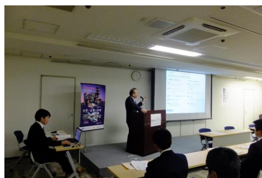
エンジニアリング産業研修会(大阪)基調講演