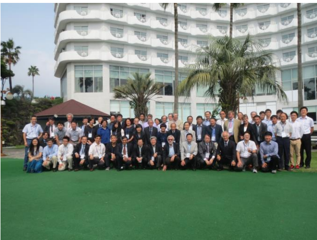
ISO/TC206第22回総会各国出席者

ISO/TC206第22回総会が、平成27年8月28日、12カ国の参加を得て、韓国・済州島で開催された。総会前の1日及び2日には、WG（ワーキンググループ）・AG（アドバイザリーグループ）会議に加えて、昨年の総会で設置が決議されたタスクグループにおいて、規格原案の審議と新業務項目の今後の取扱いなどが議論された。今年度の新業務項目11項目の内4項目は日本発の提案であり、今後も確実に規格開発プロセスを進展させ、国際規格化を目指す活動が必要である。