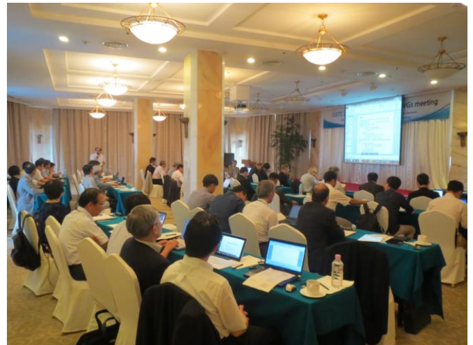
ISO/TC206第22回総会審議状況