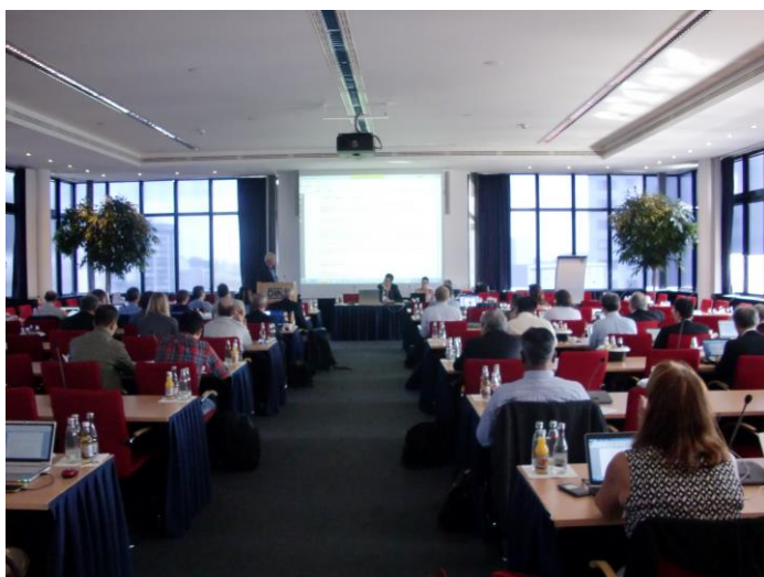
2015年ISO/TC150ベルリン総会審議状況

2015年ISO/TC150ベルリン総会及びSC(分科委員会)・WG(ワーキンググループ)会議が、平成27年が9月14日～18日、18カ国の参加を得て、ドイツ・ベルリンで開催された。日本提案の規格内容の説明を行うと共に、各国専門家と規格内容についての議論や情報交換を行った。日本発の提案に関して、今後とも規格開発プロセスを確実に進展させ、国際規格化を目指す活動が必要である。