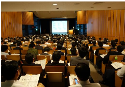
講演会・聴講風景

また、機械安全普及に係る講演会「機械安全国際規格の紹介ー非常停止、ガード及び電氣的検知保護設備ー」を実施した。