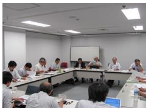
開発部会・会議風景