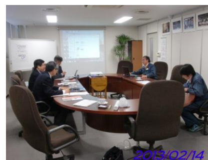
【上：コーディネータ研究会開催風景 下：事業プロデュース活動風景】