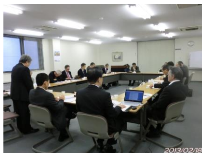
【上：事業推進委員会開催風景 下：マイルストーン分科会開催風景】