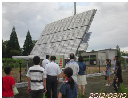
【事業化調査研究会開催風景】