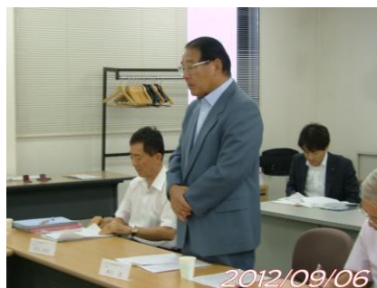
【事業化連絡会開催風景】