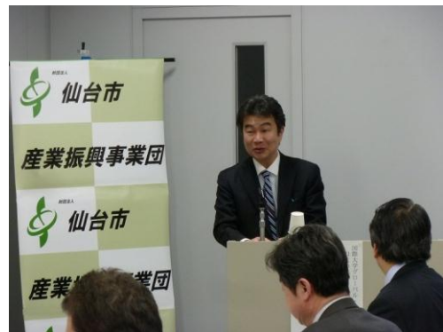
写真 6. 仙台市におけるセミナーの模様