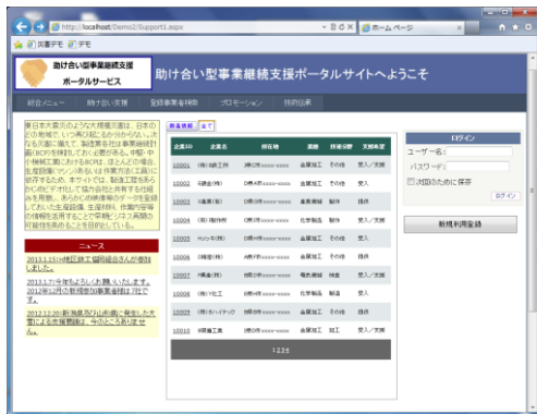
写真 5. 実証実験用プログラム画面