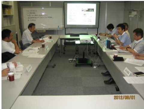
写真 1. 第 1 回委員会の模様