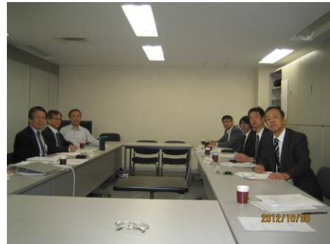
写真 2. 第 2 回委員会の模様