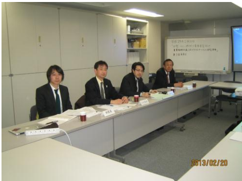
写真 3. 第 3 回委員会の模様 (1)