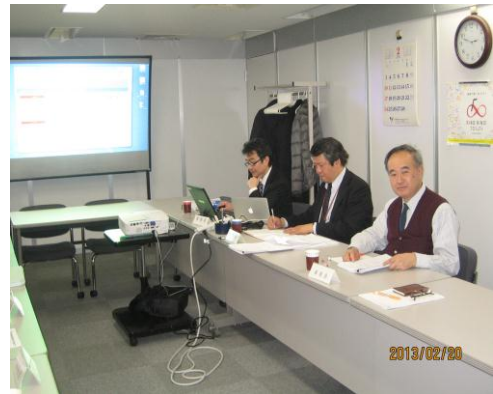
写真 4. 第 3 回委員会の模様 (2)