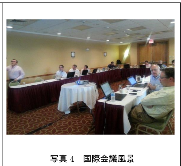
写真 4 国際会議風景