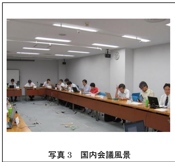
写真 3 国内会議風景