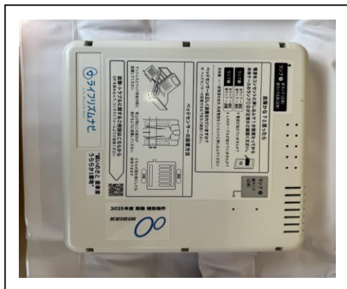
【見守りシステム機器本体】

見守り支援システム「ライフリズムナビ+Drは、入所者の生活リズムや睡眠状況を可視化し、介護や見守りを支援するシステムです。ベッド下に設置する体動センサーや人感センサー、温湿度センサーを組み合わせ、入所者の状態をリアルタイムでモニタリングし、異変の早期発見や介護業務の効率化に貢献します。