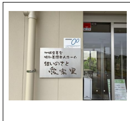
【機器設置している建物玄関】