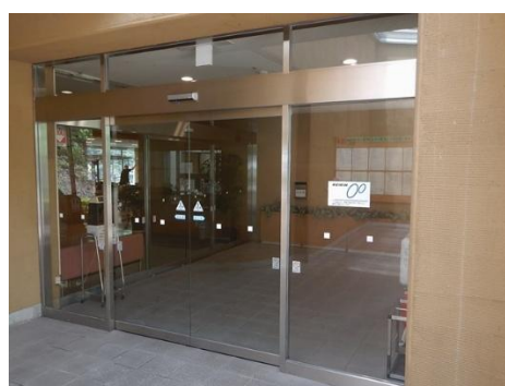
補助標識（建物入口）