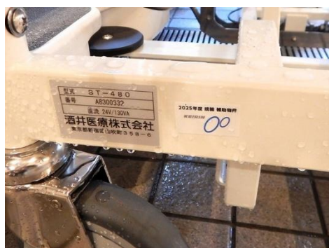
補助標識（電動ストレッチャー）