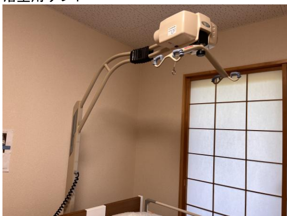
居室用ベッドセットリフト