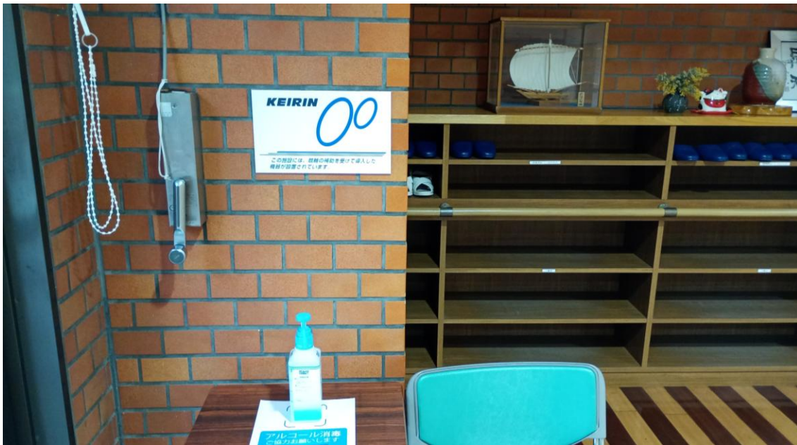
標識設置場所：特別養護老人ホーム サンシャインつくば 玄関