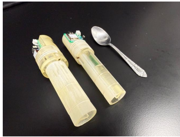
左から初期モデル・最終モデル・コーヒースプーン キッチンの中に入るサイズの小型化の実現