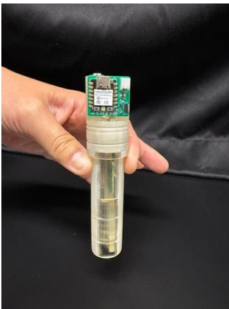
計測自動化・小型化・軽量化を実施した装置

私たちが開発してきました装置（小型粘度計）では、小型のセンサーを使って液体の流れにくさ（流動抵抗）を測定してきました。その精度は、高額な専門機器と同じくらい高いことが確認されています。しかし、この小型センサーは高価で、ご家庭や介護施設で使って頂くにはコスト面が大きな課題でした。そこで、より安価な部品を使って、新しい測定方法を開発し、今までの装置と同等の精度を保ちながらコストを抑えることに成功しました。さらに装置の構造も見直し、胴体部分の直径を20%（40mmから32mmへ）、粘度液に浸す部分の直径を約13%（30mmから26mmへ）、全長を約6%（150.4mmから140.7mmへ）の小型化を、重さは約37%（105.2gから66.6gへ）の軽量化を実現しました。