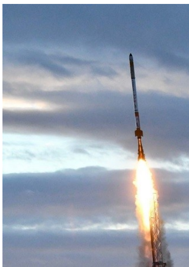
2024年12月、打上に成功。マッハ1.5を達成

2024年12月、福島県南相馬市で打上を実施しました。高度記録の更新はならなかったものの、最高速度マッハ1.5を達成。ハイブリッドロケットの国内最速記録となりました。また、機体のほぼすべての回収に成功。これもこのクラスの規模のロケットでは国内では初とみられます。これにより、機体再利用、ひいては低コスト化の第一歩を踏み出しました。