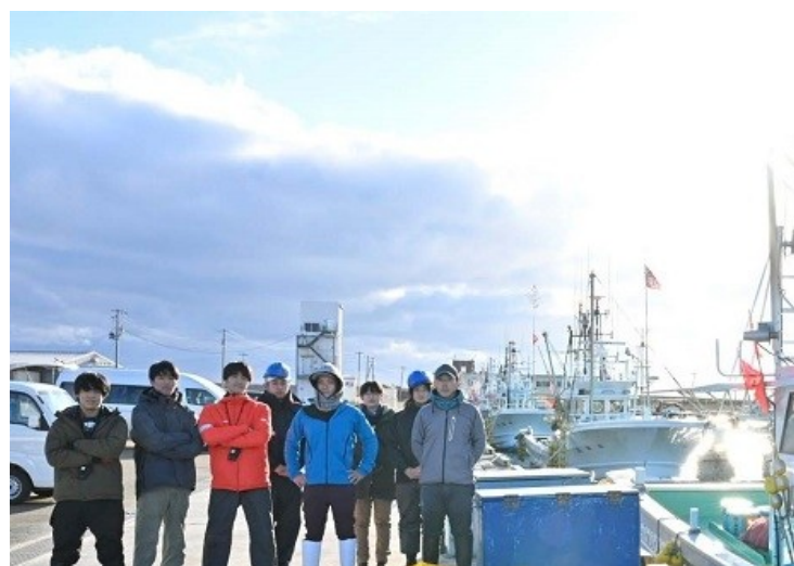
機体のほぼすべての回収に成功