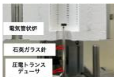
図2 高温環境下用超音波共鳴法計測装置

本事業では本手法を不活性ガス雰囲気下に拡張するには至らなかったため、高温環境下用超音波共鳴法計測装置と開閉式縦型電気炉が一式設置可能な真空チャンバーを作製し、不活性ガスで置換した状態で本手法による弾性定数計測を可能にすることが今後の課題である。