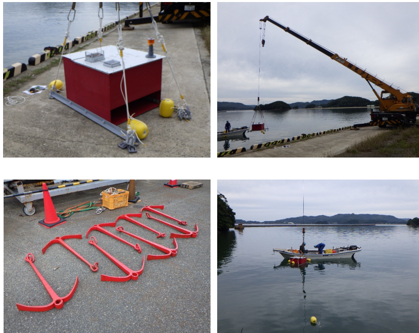
図2 (左上) 試験に使用した波力発電ブイ。(右上) 岸壁クレーンからのブイ吊上げ。 (左下) 係留に用いた唐人錨。(右下) 作業船による位置決めと投錨