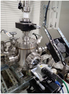
開発したレーザ加熱装置