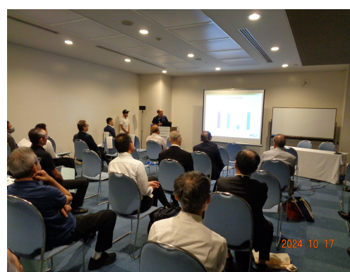
【JKA補助事業成果発表会開催風景】