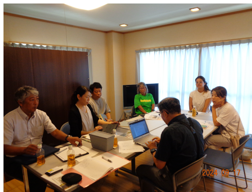
【ブラッシュアップ研究会開催風景】