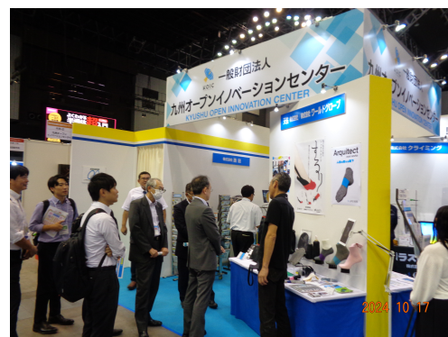
【モノづくりフェア2024出展風景】