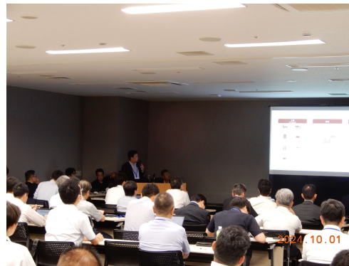
【セミナー開催風景（カーボンニュートラル普及啓発セミナー）】