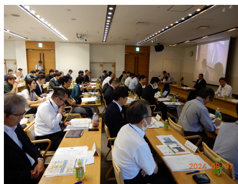
【セミナー開催風景（九州・大学発振興実践会議）】