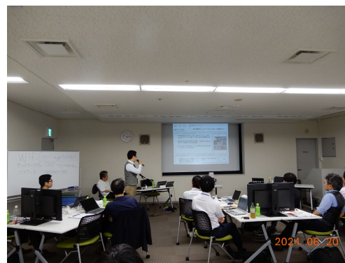
【セミナー開催風景 (九州ネクストリーダー塾)】