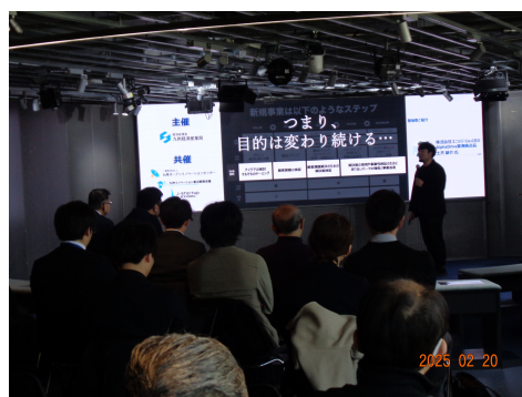
【セミナー開催風景（イノベーションフォーラム）】