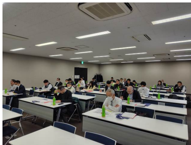
名古屋会場 受講風景