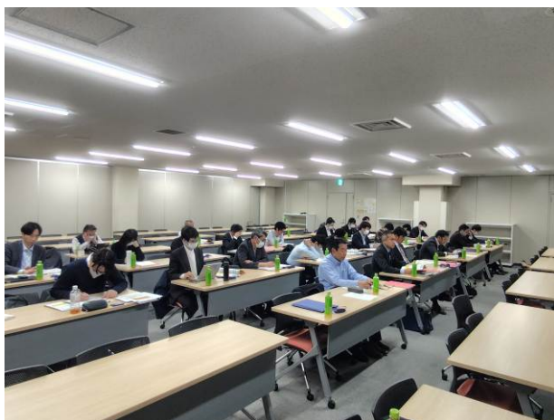
東京会場 受講風景