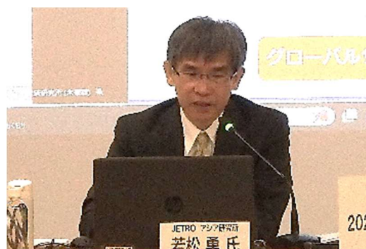
通商委員会における専門家の講演 (3)