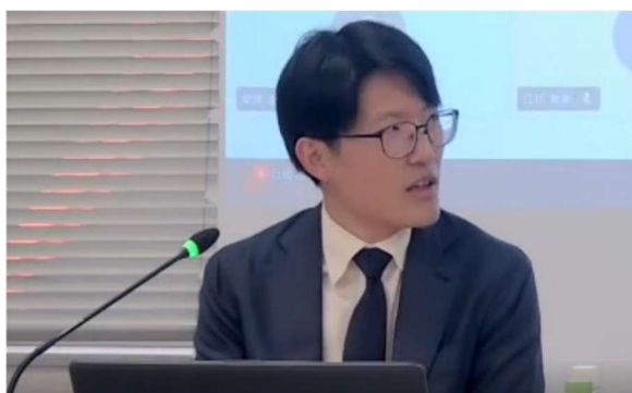
通商委員会における専門家の講演 (2)