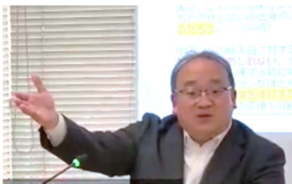
通商セミナーにおける専門家の講演（1）