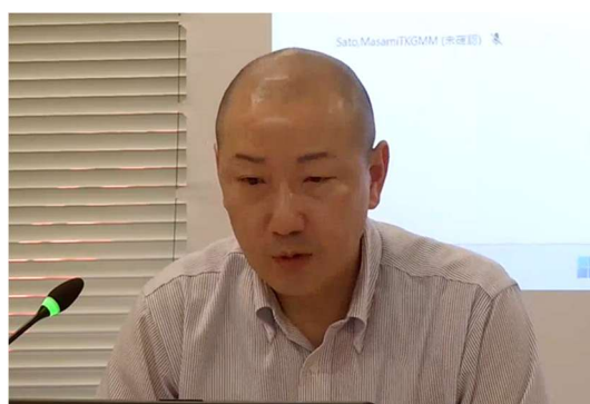
通商委員会における専門家の講演（1）