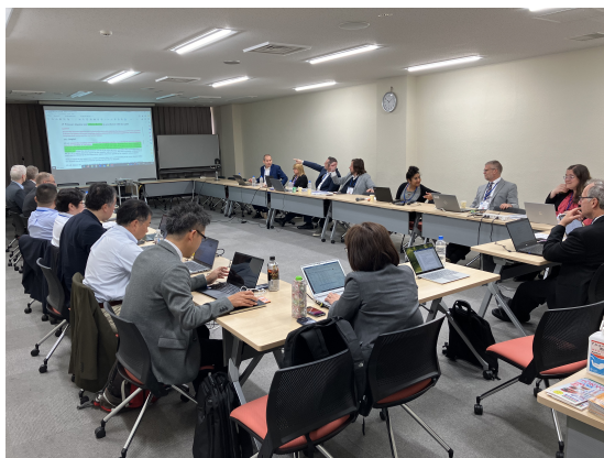
ISO/TC131 国際会議（対面会議）の様子

①今年度は、ISO/TC131国際会議は対面で、春季@東京、秋季@ロンドンにて開催され、その他、不定期でウェブ会議にも参加した。ISO/TC118はウェブ会議と対面会議の両方に参加、いずれも日本の意見の反映に努めた。 http://www.jfpa.biz/PDF/JKA2024M-021.pdf また、発行されたISO審議案件92件についてすべて回答し、日本の意見の反映に努めた。