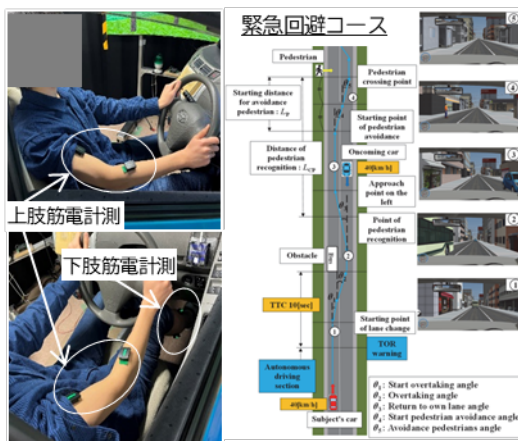
図2 検討中の緊急回避動作を含むステアリング操作の評価と上肢動作の定量化技術の開発

【内容】緊急ブレーキやステアリング操作などの運転動作が必要な複数の実走を模擬したV. R. コースを構築し、下肢動作と同様に上肢動作の特徴を運動力学的・神経科学的な視点から定量的に評価ができる実験装置と評価指標を仮決定した（図2）。