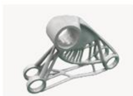
ベルクランク (構造最適化)