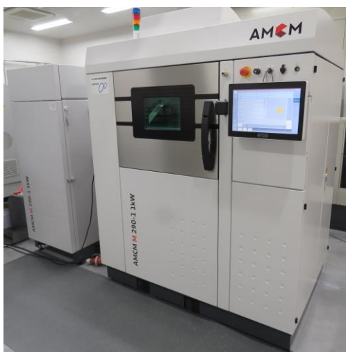
金属 3D レーザ積層造形装置

本装置は、粉末床溶融結合方式(Powder Bed Fusion)の金属3Dプリンタです。本装置は1kW級の高出力レーザを搭載しているため、造形速度の高速化により生産性が大幅に向上しており、造形可能な材料の種類も豊富です。また、パルス照射機能により従来機器では難しかった0.1mm程度の薄肉造形が可能です。さらに、内蔵カメラによるモニタリング機能を有しており、製品製造時の課題である造形物の品質管理に用いることができます。