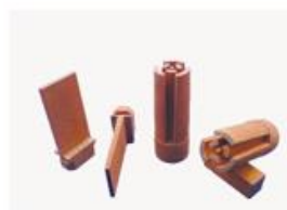
放電加工用工具電極