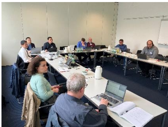
ISO/TC131 国際会議（対面会議）の様子

また、発行されたISO審議案件123件についてすべて回答し、日本の意見の反映に努めた。