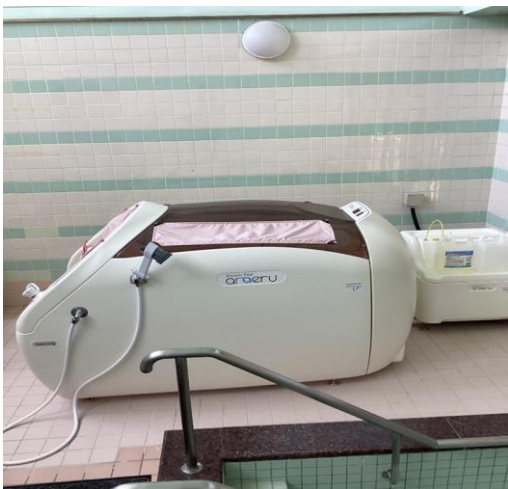
特殊浴槽（シャワードーム型入浴機器）