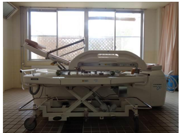
(電動昇降式ストレッチャー&担架)