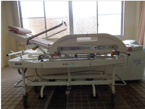
(ストレッチャー&担架)