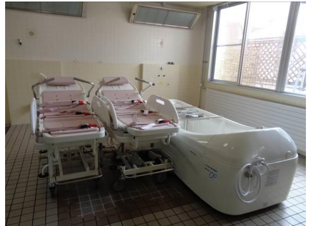
(ストレッチャー&浴槽)