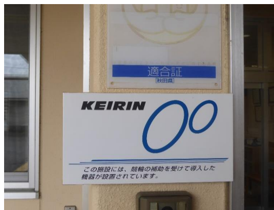
正面玄関 JKAプレート掲示