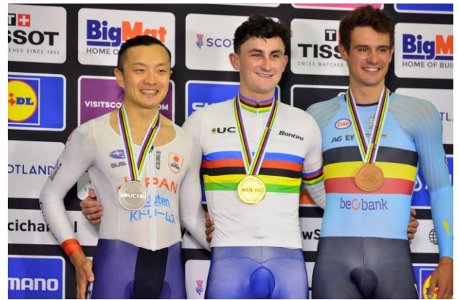
世界選手権にて 男子スクラッチ表彰台