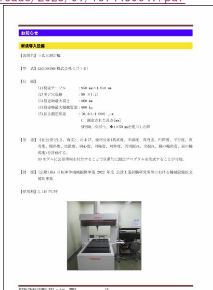
「Challenge 227号」 掲載ページ (15p)