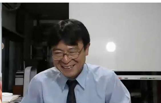
通商委員会における専門家の講演 (1)