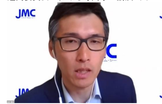
通商セミナーにおける専門家の講演 (2)