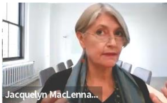
通商セミナーにおける専門家の講演 (1)