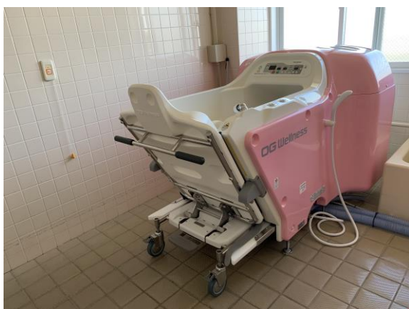
特殊浴槽 オージー技研 Tuuti

オージー技研の特殊浴槽一式（車椅子介護浴槽 Tuuti 新湯式浴槽1台、専用車椅子1台）を導入した。専用車椅子に座ったままで浴槽に連結すると同時に貯湯を開始するので、短時間で温まることができる。また、肩かけシャワーにてより湯冷めを防ぐことができる。