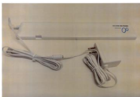
バイタルセンサー