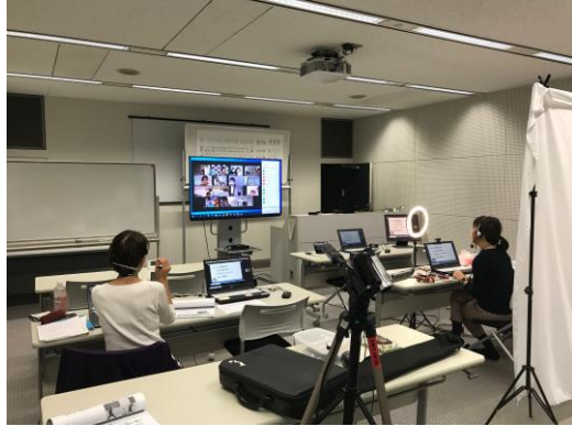
写真1 ロボカップジュニア集中講座①