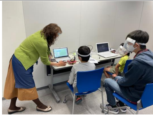
写真3 ロボカップジュニア集中講座③