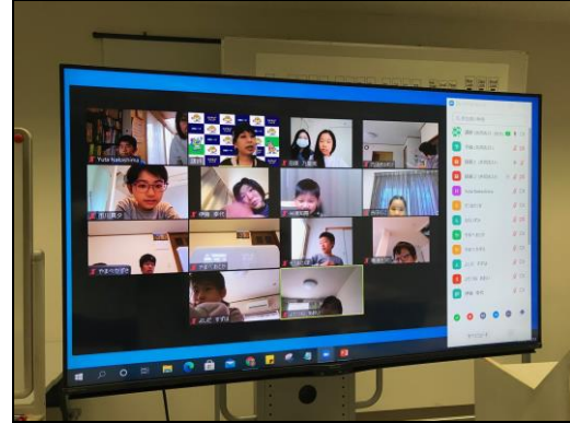
写真2 ロボカップジュニア集中講座②