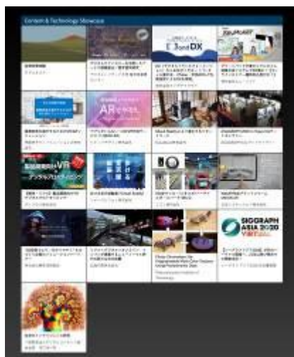
Content & Technology Showcase 出展一覧（オンライン会場）

17社の先進的なコンテンツ技術とデジタルコンテンツを、DGEXPO 2020 ONLINE Webサイトに設けた専用スペースにオンライン展示した。