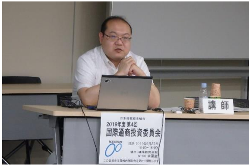
通商委員会における専門家の講演（2）