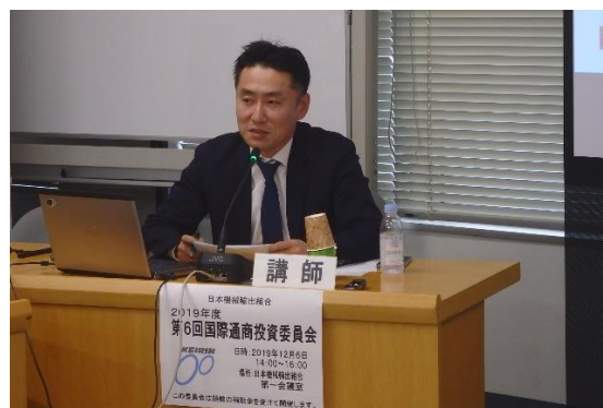
通商委員会における専門家の講演(1)