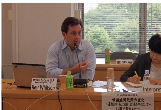
通商セミナーにおける専門家の講演(1)

『各国・地域の貿易・投資障壁の改善に関する提言』(11月)(経済産業大臣、外務大臣、財務大臣)