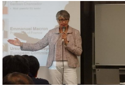
通商セミナーにおける専門家の講演（2）